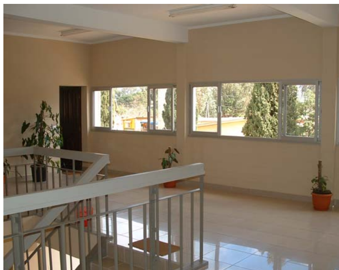
Les locaux de CEDS

Organisme doté du statut consultatif auprès du Conseil Économique et Social de l'ONU