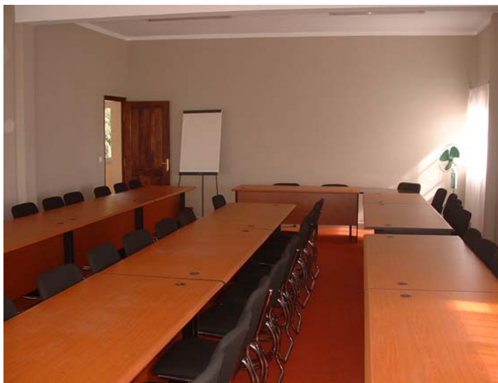
Une salle de conférence (salle rouge)

Organisme doté du statut consultatif auprès du Conseil Économique et Social de l'ONU